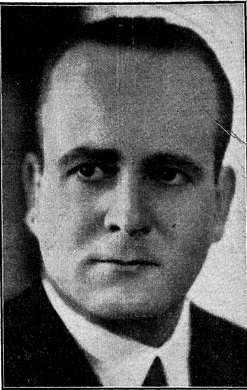
Don Juan de la Cierva y Codorniu, inventor del autogiro, a quien la Federación Aeronáutica Internacional ha concedido su Gran Medalla de Oro del año 1932

El galardón otorgado al señor Cierva es la más alta recompensa aeronáutica mundial y supone el reconocimiento oficial del gran servicio prestado por el ingeniero español al progreso de la aeronáutica. La Gran Medalla de Oro no se ha concedido desde su fundación más que a los aviadores o técnicos siguientes: De Pinedo, Alan Cobham, Lindbergh, Hinkler, Costes, Balbo y Eckener.