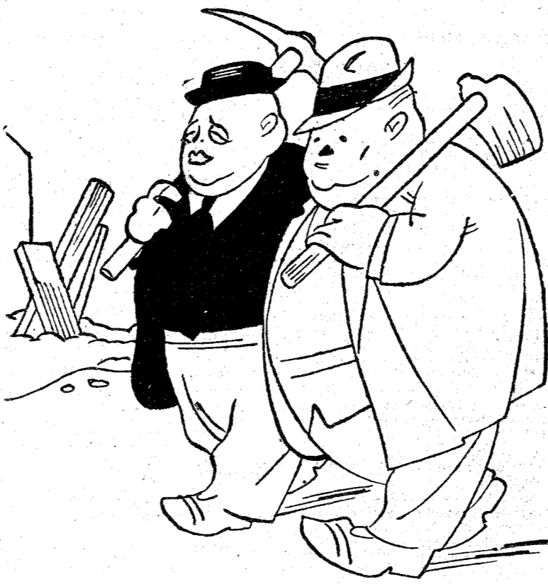
El gordo y una aproximación.