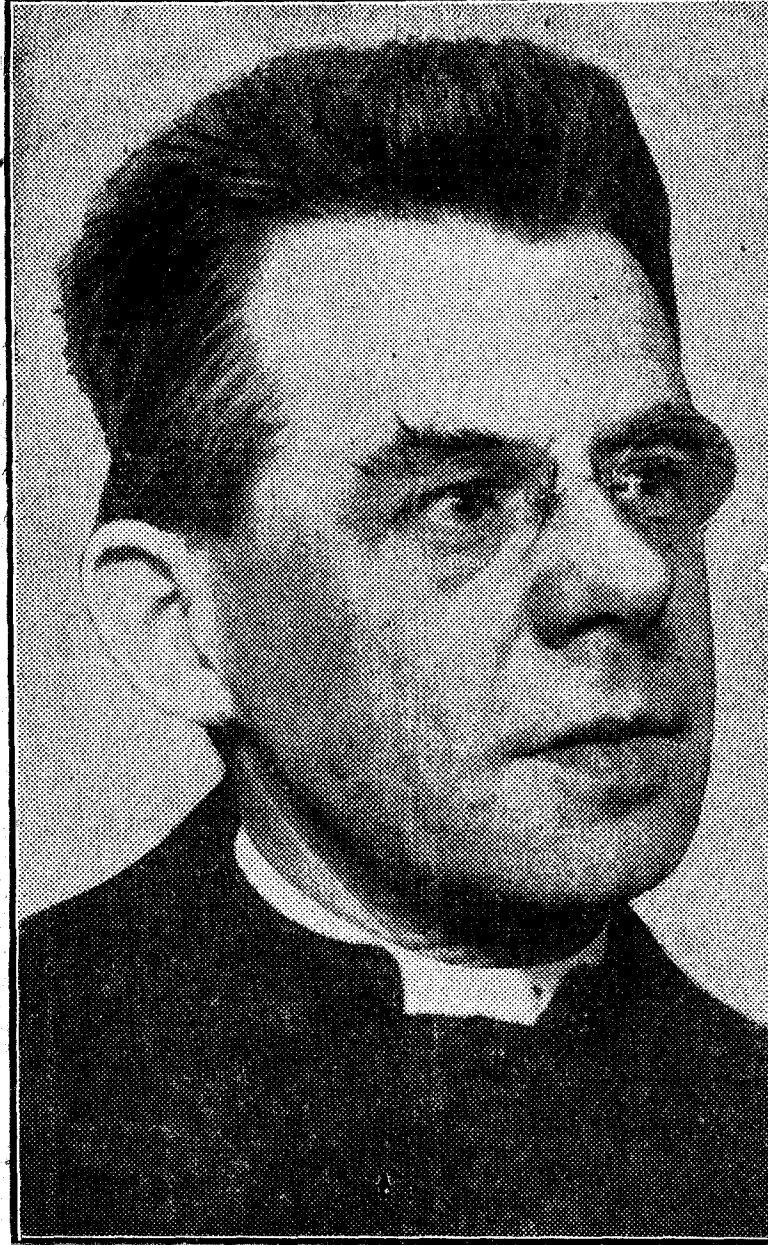
El fundador de la Juventud Obrera Católica Belga, canónigo Cardayin, que ha llegado a Madrid

Hijo de obreros y empleado de una Empresa antes de hacer la carrera eclesiástica, el ilustre sacerdote belga sufrió hondamente al ver cómo sus antiguos camaradas, educados en escuelas cristianas, se apartaban de la Iglesia, atraídos por el socialismo. Unos años de trabajo constante, de intenso apostolado, de propaganda continua y de perfecta y moderna organización han bastado para cambiar tal estado de cosas. El socialismo ha sido batido en la juventud belga. Cientos mil obreros industrialmente de ambos sexos inscritos en la J. O. C., número al parecer, cuatro veces mayor que de jóvenes socialistas, sirven de testimonio.