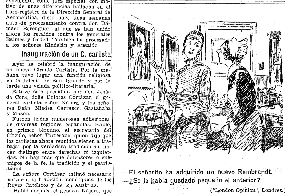
—El señorito ha adquirido un nuevo Rembrandt. —¿Se le había quedado pequeño el anterior? ("London Opinion", Londres.)