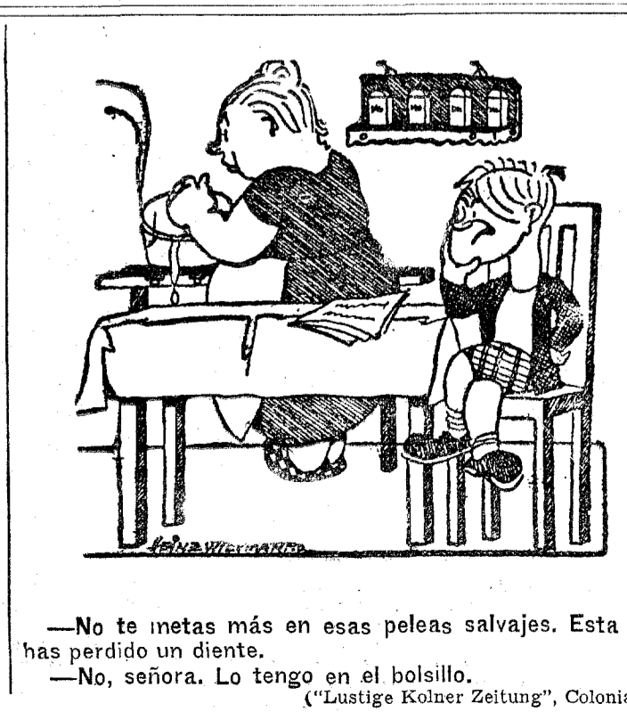
—No te metas más en esas peleas salvajes. Esta vez has perdido un diente. —No, señora. Lo tengo en el bolsillo. ("Lustige Kolner Zeitung", Colonia.)