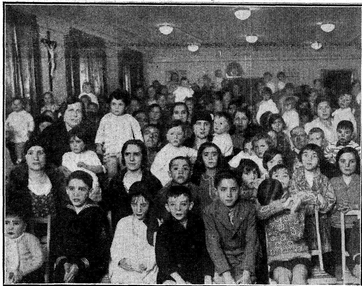
Un aspecto del salón donde se celebró la fiesta de Reyes con que fueron agasajados los hijos del personal de las distintas secciones de EL DEBATE. Varios centenares de pequeños presenciaron aquí regocijadamente una sesión de "cine" infantil