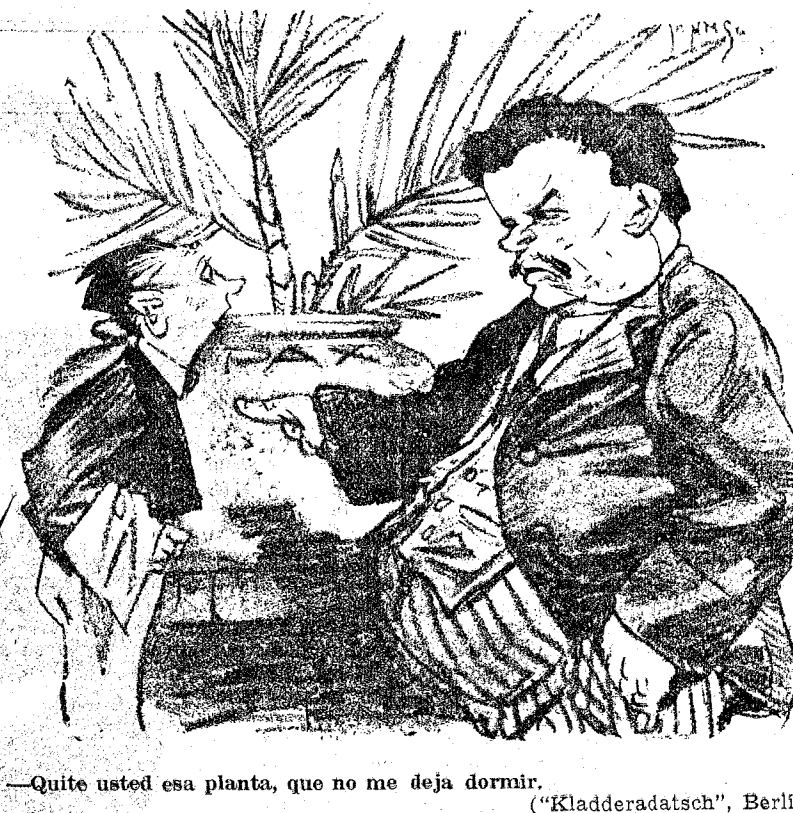
—Quite usted esa planta, que no me deja dormir. ("Kladderatsch", Berlín.)