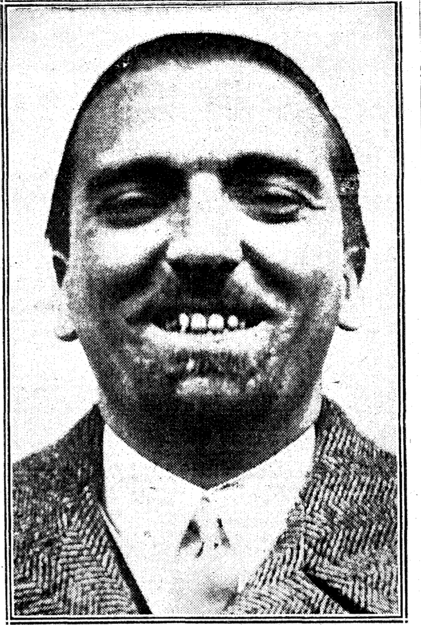
Grandi, ex ministro de Negocios Extranjeros de Italia, nombrado embajador en Londres

Grandi es un ejemplo típico de ascensión rápida en la Italia fascista. No llegaba a los treinta años cuando fue elegido subsecretario de Negocios Extranjeros, y en la actualidad, después de tres años de ministerio, apenas pasa de los treinta y cinco.