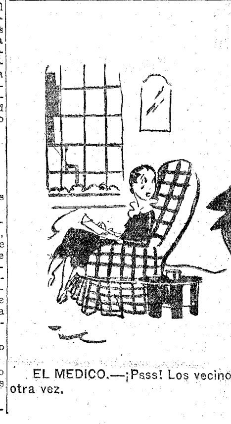
EL MEDICO.—¡Pss! Los vecinos de al lado están riñendo otra vez. ("Everybody's", Londres.)