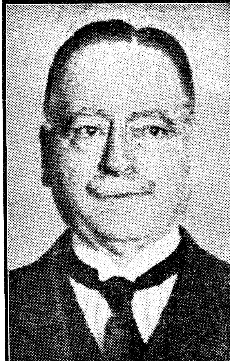
El conde de Broqueville, nuevo presidente del Consejo de ministros en Bélgica

El jefe del Gobierno belga parece destinado a presidir los destinos de su país en los momentos graves. Primero, durante la guerra; ahora, en otro combate menos brillante, pero no menos difícil, contra la situación económica.