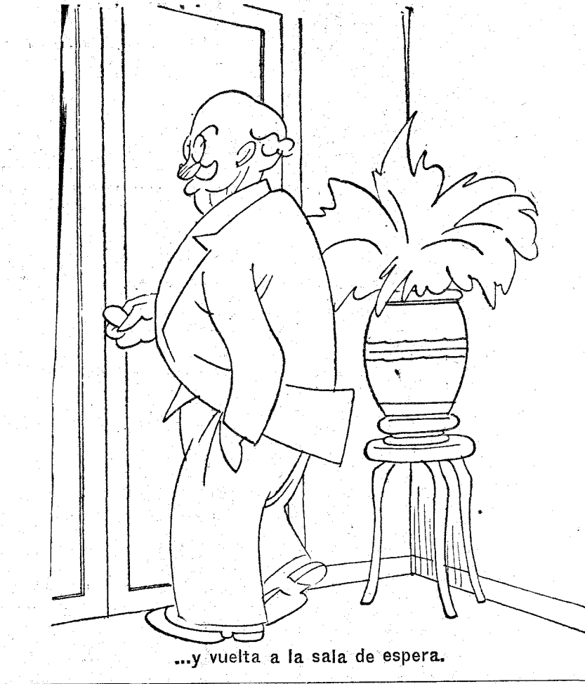
...y vuelta a la sala de espera.