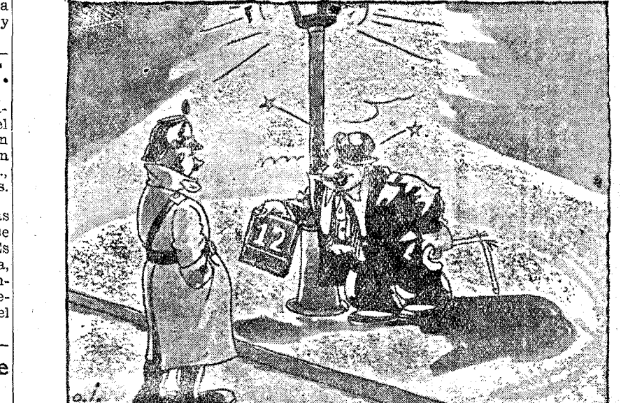
—¿Que dónde vivo? Pues aquí, en este número, que para eso tuve la precaución de arrancarlo de la fachada antes de irme.