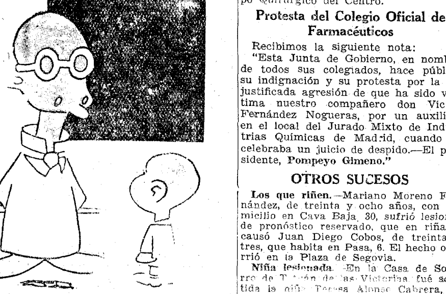
—Vamos a ver. ¿Qué pasó en el año 1547? —Que nació Cervantes.