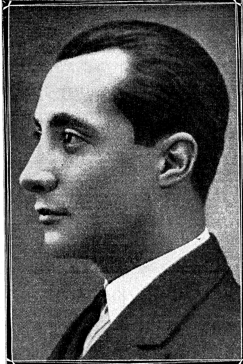
Don José Antonio Primo de Rivera, abogado defensor de don Galo Ponte en el proceso de Responsabilidades, que ha hecho un informe brillantísimo, en el fondo del cual se destacaba el recuerdo emocionado y el enaltecimiento de la memoria del ilustre marqués de Estella