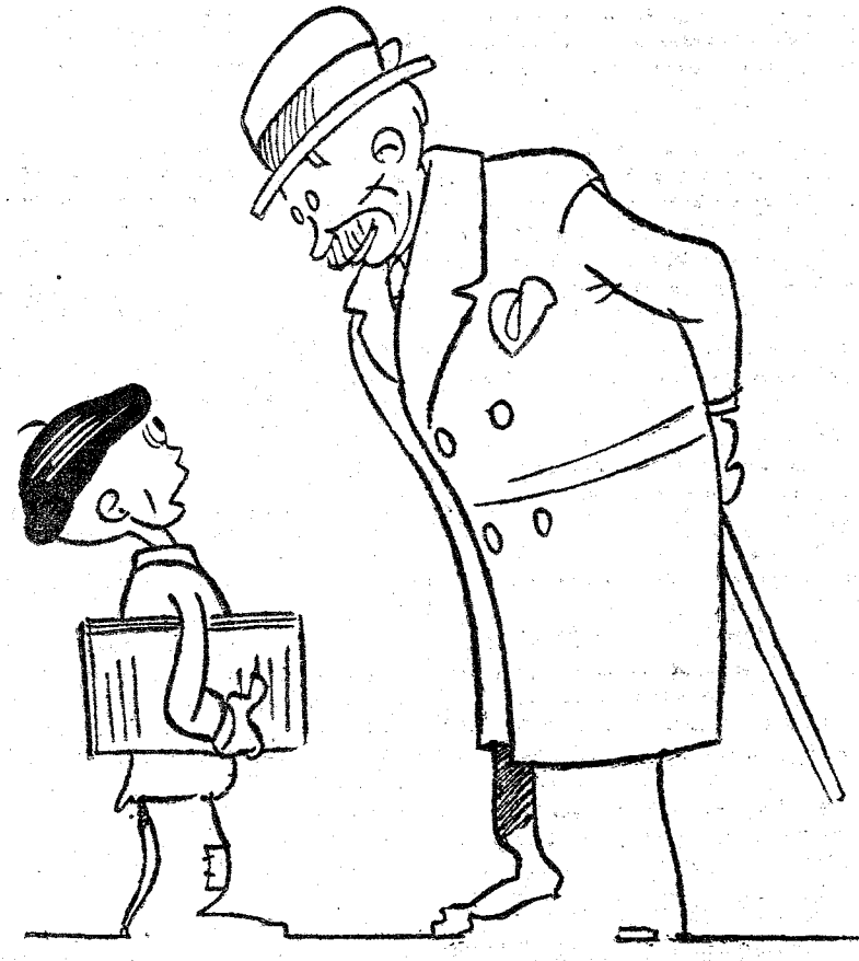
-Te encuentro triste, muchacho; ¿qué te pasa? -Nada; que me he examinado en el colegio y se conoce que se han enterado que ando en esto de la Prensa y me han suspendido.