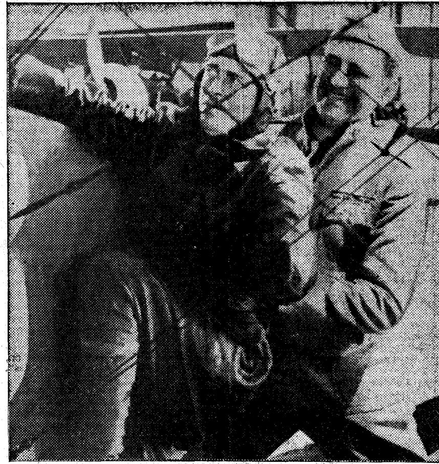
Una escena del divertido "film" de aviación "Diablos celestiales". Próximo estreno en Figaro