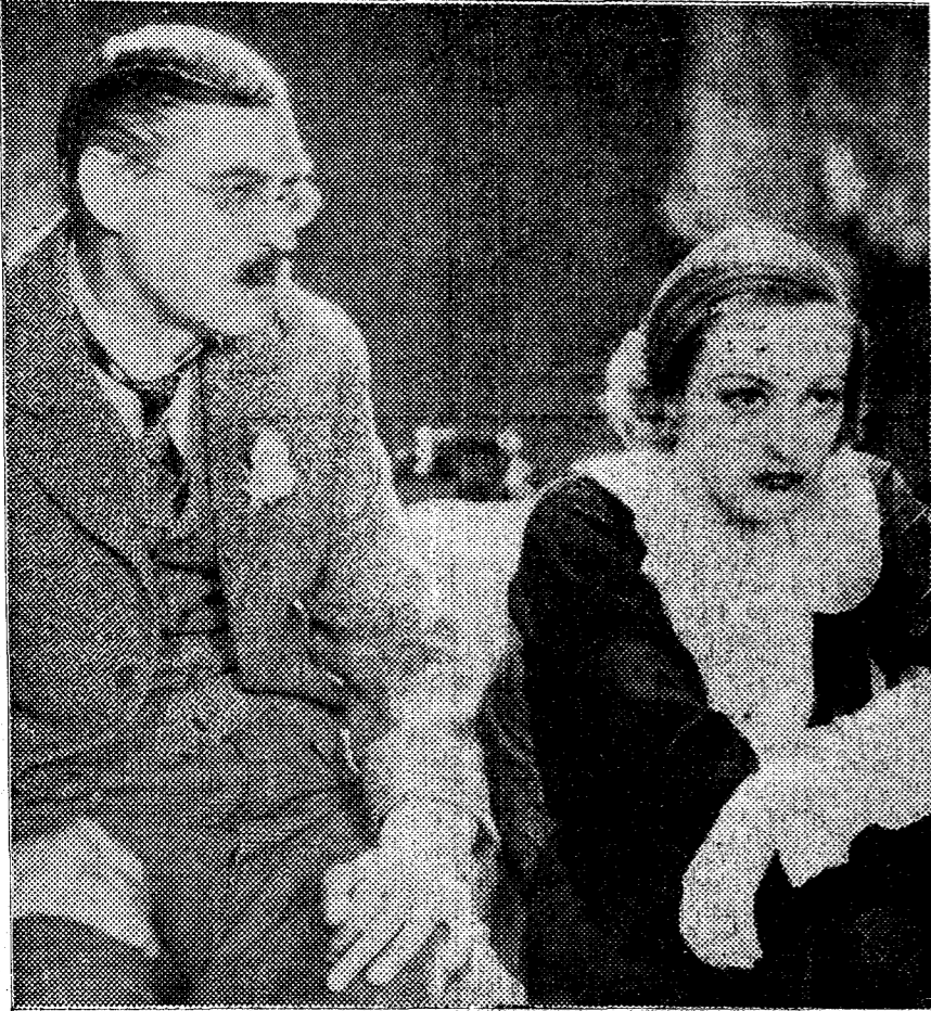
Lionel Barrymore y Joan Crawford en "Grand Hotel", con que se inaugura el Palacio de la Música el próximo sábado