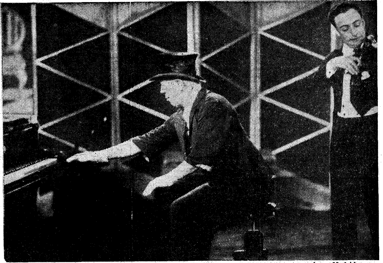
Una escena de "Grock o la vida de un gran artista", que pronto se estrenará en Madrid