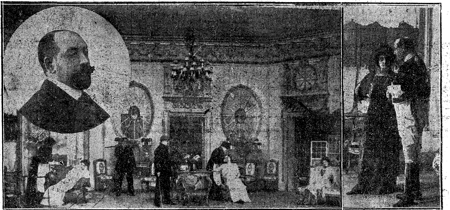
Dos escenas del tercer acto de la obra 'Doña Desdenes', que se estrena esta noche en el teatro de la Princesa y el retrato del autor, Sr. Linares Rivas.

«El Ayuntamiento de Madrid está en guerra por esa funesta sustitución. Yo he expuesto mi criterio de que se debía procurar el abaratamiento de las subsistencias; es un problema interesantísimo.»