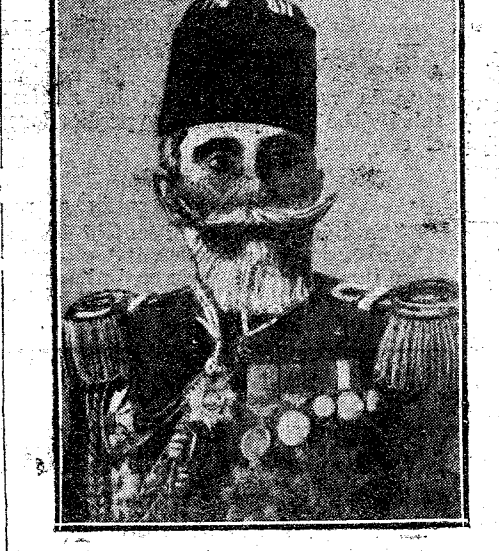
CHÉRIF PACHA ex ministro de la Guerra.