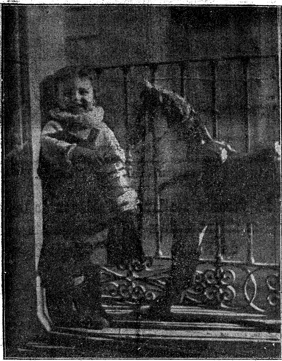
REGALO DE REYES

En los últimos días del mes actual se celebrarán en Cheshire y Lancashire 40 reuniones promovidas por los unionistas para protestar del proyecto de autonomía de Irlanda.