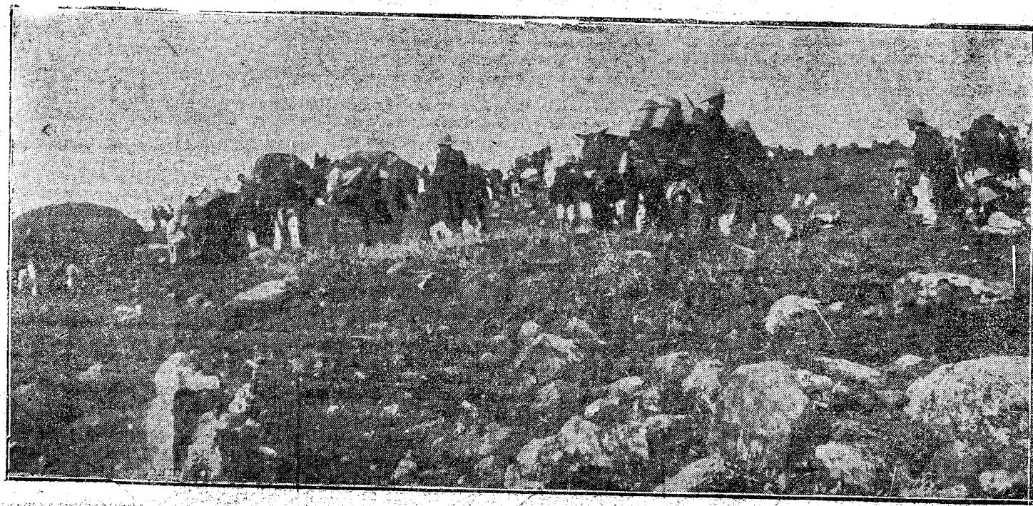
Llegada de la impedimenta al monte Arruit.

Le Journal se ocupa de los rumores de ocupación de Arzila, y dice que de ser exactos, Francia tendría serios motivos para commoverse, pues el Gabinete de Madrid se comprometió á limitar su radio de acción.