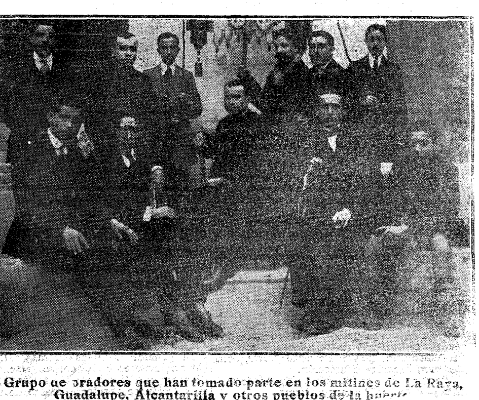
Grupo de obradores que han tomado parte en los mitines de La Raza, Guadalupe, Alcantarilla y otros pueblos de la zona.