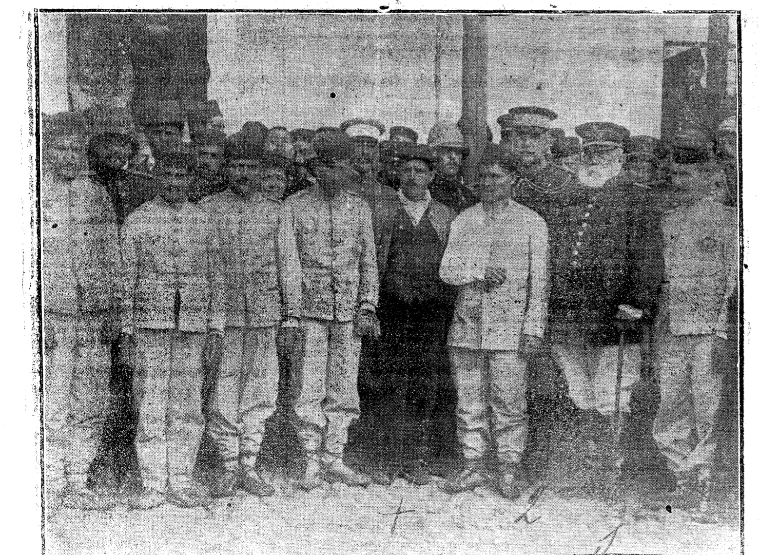
El capitán general García Aldave (1.º), el general Jordana (2.º), acompañados del cantinero X y soldados del regimiento de Infantería de Melilla que fueron prisioneros en el combate del 27 de Diciembre último, á su regreso á la plaza.

La edición está dedicada al entusiasta favorecedor de la Buena Prensa, D. José María de Urquijo, cuya actividad como organizador de Acción Católica y cuyas energías para defender en todo momento los fueros de nuestra Santa Religión merecen premios como el que significa la dedicación con que le distingue el ilustre Prelado.