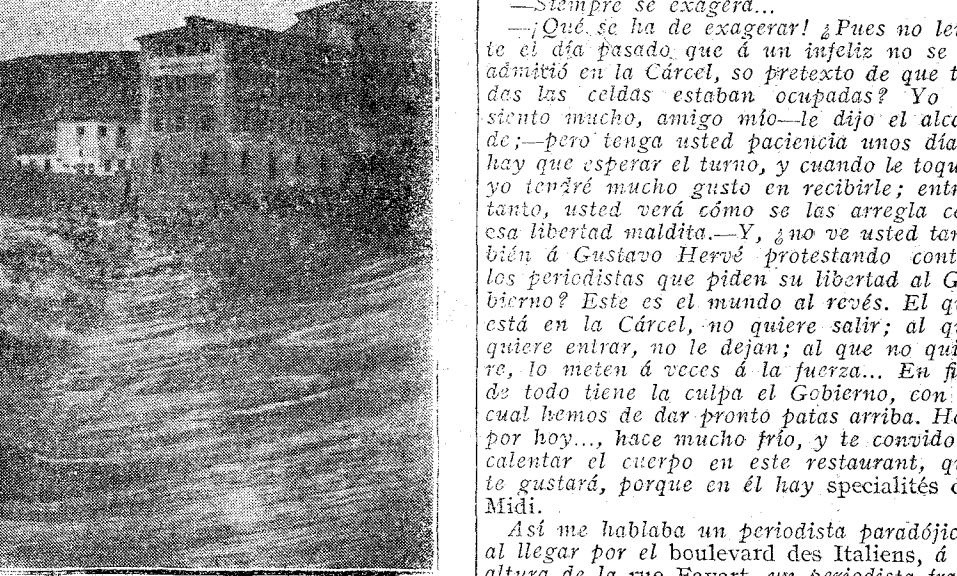
TOLEDO.—Crecida del Tajo. Una presa.

ral es como una herencia que está en nuestra mano el aceptarla ó renunciarla, ó como las moscas ó las pulgas, que, si nos viene en gana, podemos sacudirnoslas. De ninguna manera. Como el señor Canalejas resulta cómplice de alguna inmundicia ó injusticia, sobre él recaerá parte de la responsabilidad, sin que le valga esa renuncia que por anticipado nos hace. Volvemos á repetirlo. Ahora más que nunca debemos gritar todos los amantes de la justicia y del derecho: luz, mucha luz; vayamos al debate; si hay que depurar responsabilidades, depúrense, sea quien sea el culpable, sin contemplaciones, sin miramientos, sin cobardía.