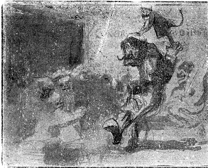
—¿Se vistió de seda? —... de todos modos se ha quedado mona.