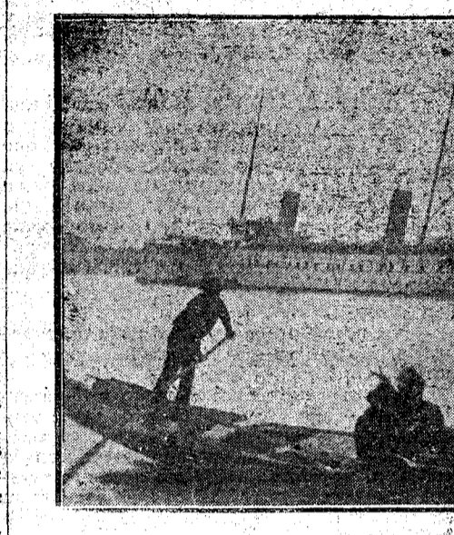
EL KAISER DE VIAJE.—El yate imperial "Hohenzollern", anclado en Venecia.

Decla Lloyd George en la Cámara de los Comunes al discutir el bill del salario mínimo, contestando á lord R. Cecil, que había hablado de los graves trastornos sociales con que amenaza el sindicalismo: «Yo no participo de los temores del noble lord con respecto á los sindicalistas; el peligro no es tan grave como él se imagina. Sindicalismo y socialismo son cosas enteramente diversas; son dos cosas que mutuamente se destruyen; el sindicalismo puede levantar obstáculos tan formidables en el camino del socialismo, que se convierta en su enemigo más encarnizado, y por esto yo creo que el mejor policía para el sindicalista es el socialista.»