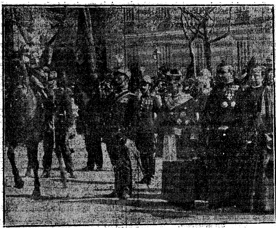
DETALLE DE LA JURA DE LA BANDERA

Formaba también en la comitiva de Su Majestad el Infante Don Fernando, con uniforme de teniente coronel de la Escolta Real. En coches de Palacio iban SS. MM. las Reinas Victoria y María Cristina, las Infantas María Teresa, Isabel y María Luisa, el Infante Don Alfonso de Borbón, hijo del Infante Don Carlos, que vestía de Húsar de segundo teniente del regimiento de Húsares de la Princesa; el Príncipe Leopoldo de Battemberg, con uniforme de oficial de Artillería