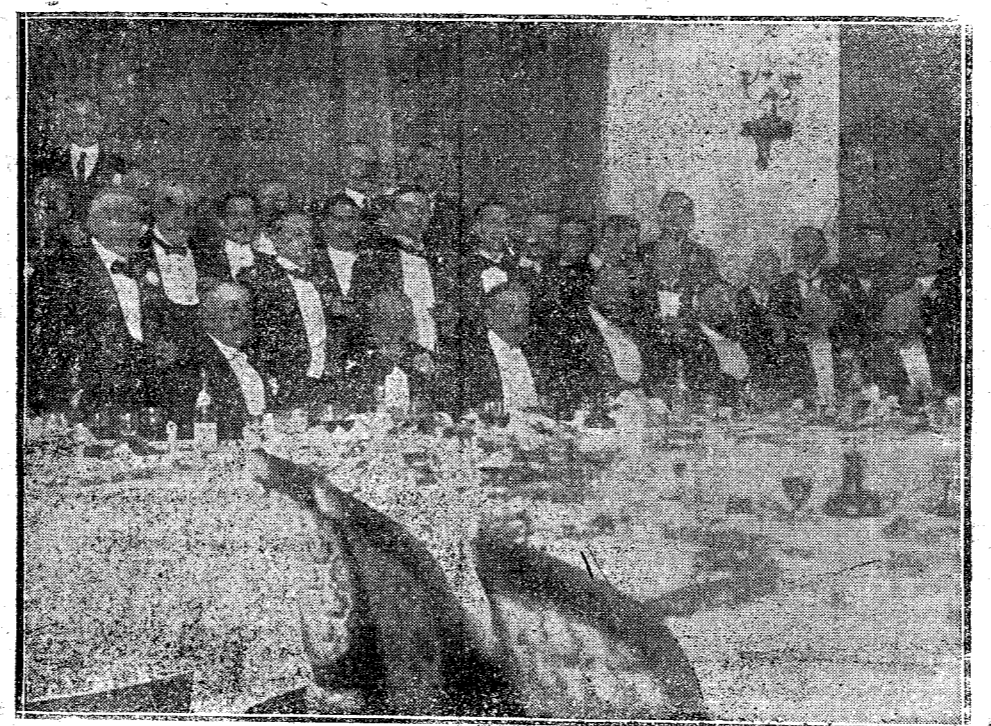
Banquete del Cuerpo de Correos en el hotel Ritz, celebrado anteanoche.

Asegura la Prensa alemana que tal proceder sería desconocer y olvidar la política de Monroe.