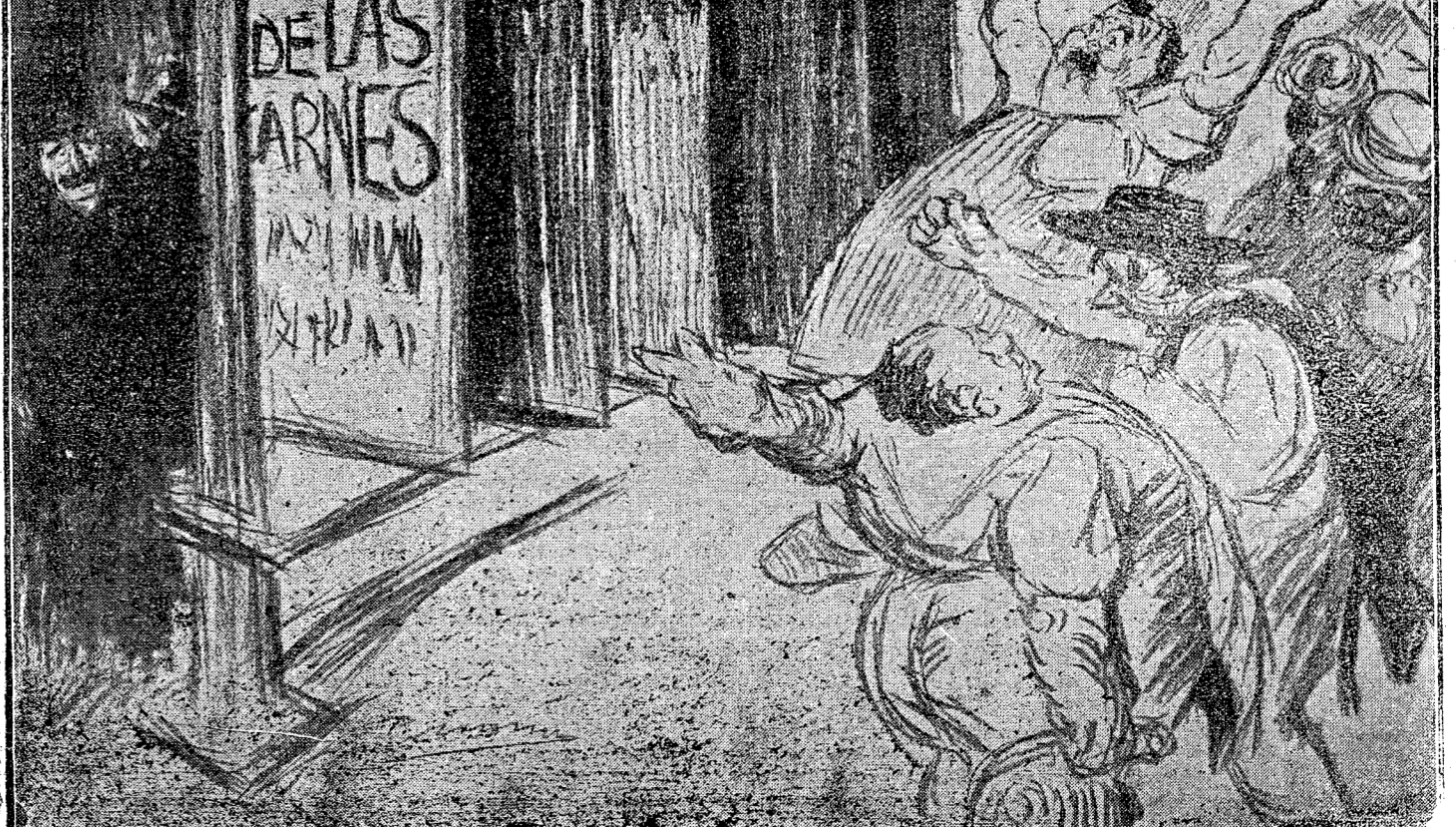
CANALEJAS.—¿Qué gritan? ¿Gritan? —Pues que eso del concierto, es música; y que lo que hace falta es «surmirir de verdad» les canchales.