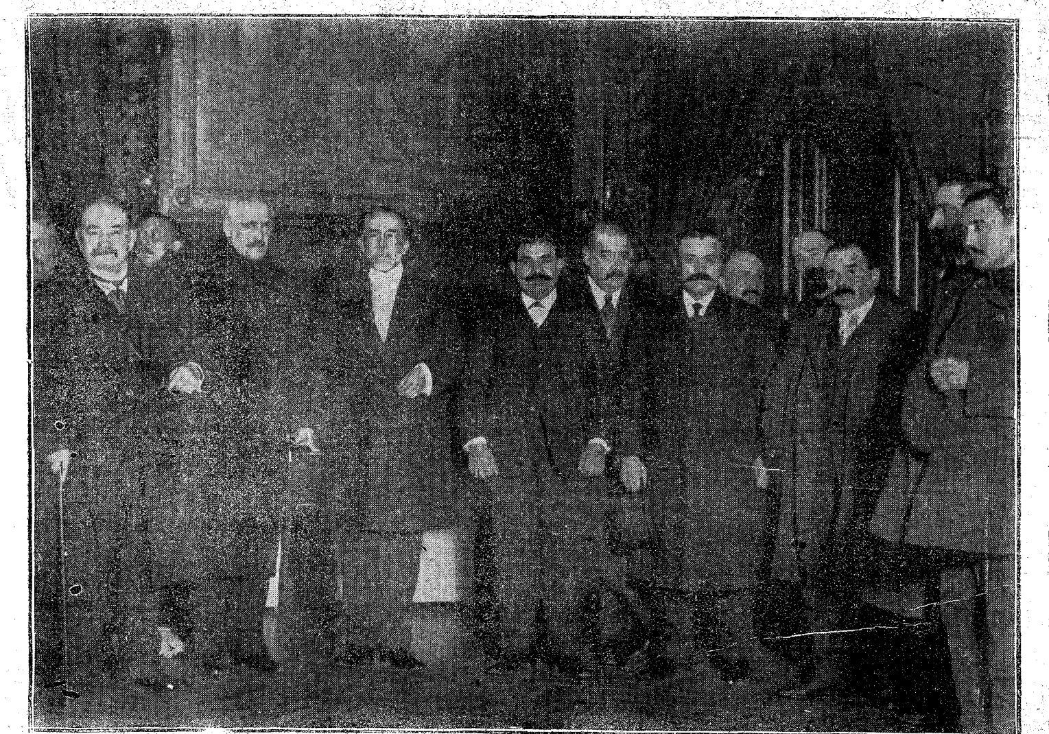
REUNIÓN DE LOS ALMACENISTAS DE CARBÓN, EN EL DESPACHO DEL ALCALDE DE MADRID

documentos y detalles de lo actuado hasta aquí en las negociaciones, y que creía que sólo a este asunto se reduciría el Consejo. El Consejo terminó a las doce y cuarto de la noche. El Sr. Gasset, encargado de facilitar una referencia a los periodistas, dijo lo siguiente: —Señores, créed que hubiera más expectación, pero no son ustedes muchos. Han hecho bien en no venir, porque, realmente, del Consejo sólo puedo decir dos palabras. Hemos tratado de los debates parlamentarios; el Sr. García Prieto, durante hora y media, nos ha informado de la marcha de las negociaciones y de los trabajos que referentes a la administración en Marruecos realiza la Comisión nombrada, y de lo que nada puedo decir; y yo he hablado de los preparativos de las Compañías ferroviarias para transportar carbón donde sea preciso, tras de lo que aprobamos un expediente prorrogando la concesión de la red telefónica del NO. de España. Como lo que va escrito fué lo único que dijo el Sr. Gasset, los periodistas, al salir, decían que les habían dado el timo de los perdigones con la supradicha referencia.