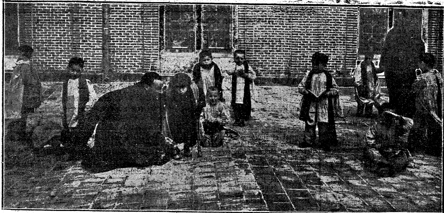
EL HERMANO PORTERO, JUGANDO CON LOS NIÑOS EN LA TERRAZA DEL ASILO

«Oh, el bello ejemplo! Yo ante el comprendí mejor que con otro cualquier estímulo de la reflexión, las grandes iniciativas que para convertir y perfeccionar tienen, sin que de ello se den cuenta, esos hombres, grandes en su humildad, que poniendo el sacrificio propio al servicio de la ajena desgracia, consumen