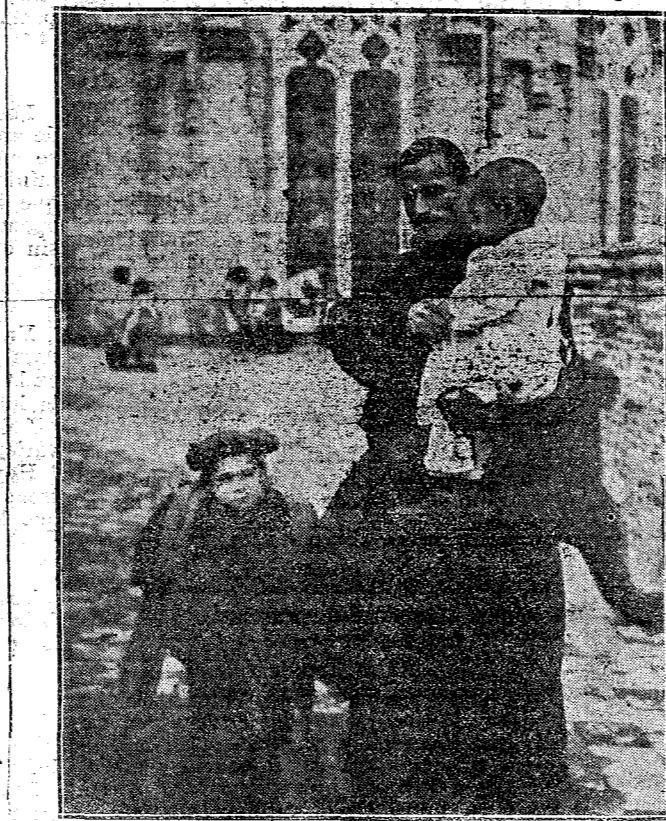
Uno de los Hermanos de San Juan de Dios, con dos asilados.

Un sayal tosco, oscuro, una voluntad férrea, un corazón henchido de amor, un alma llena de ambiciones á lo eterno, una paciencia inextinguible, una humildad ejemplar. He aquí un Hermano de San Juan de Dios. He aquí la Comunidad que cuida de los pequeños desvalidos en el Asilo de San Rafael.