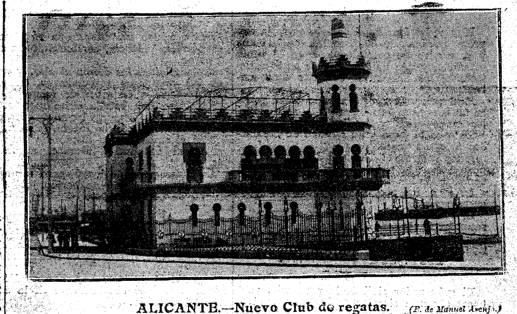
ALICANTE.—Nuevo Club de regatas.

Con verdadera fuerza de argumentación combate el mal llamado desdoble y graduación de escuelas, que, como la elevación del sueldo de los maestros, es otro engaño. Cuando el Sr. Silió analiza el uso que se ha hecho del dinero que se ha gastado en la ciencia ni para la enseñanza.