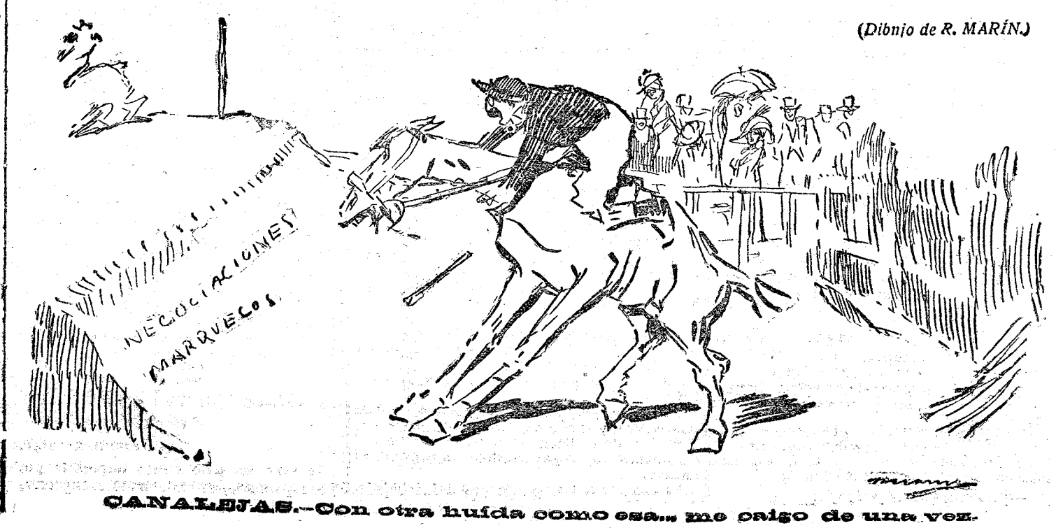
CANALEJAS.—Con otra huida como esa... me pago de una vez.