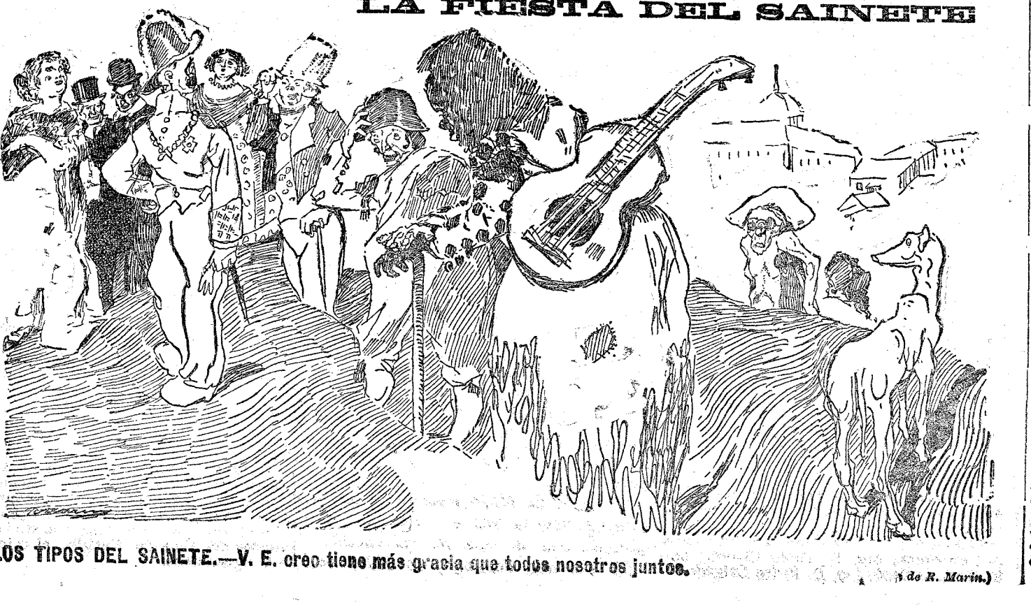
LOS TIPOS DEL SAINETE.—V. E. creo tiene más gracia que todos nosotros juntos.

El periódico El Intransigente, órgano de los elementos disidentes de Lerroux, publicó un largo artículo contra el jefe radical, atacándole por haberse olvidado en su discurso de Zaragoza de los presos políticos por delitos cometidos el año 1909.