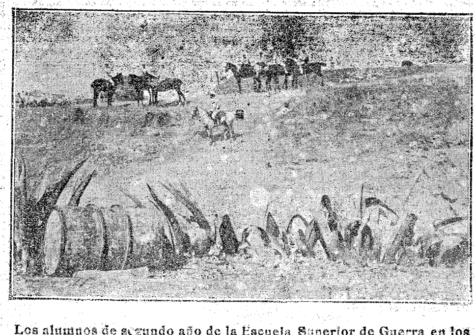
Los alumnos de segundo año de la Escuela Superior de Guerra en los alrededores del campamento de Avanzamiento.

Solución de una huelga. Ha terminado la huelga de pañaderos, con motivo de un acuerdo celebrado entre el Municipio y los patronos fabricantes de pañ.