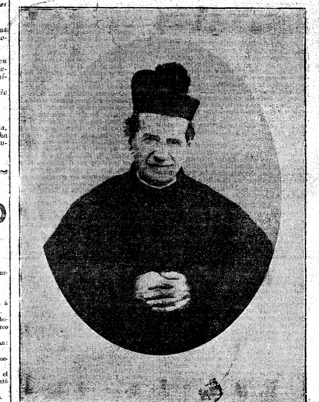
EL VENERABLE JUAN BOSCO, fundador de la gran obra salesiana.

¿Queréis conmigo asistir á la infancia de esta institución eminentemente católica-social? Os interesa, lectores, aprender cómo lucharon los primeros albores de esta sociedad, que poco á poco va iluminando el mundo? Pues ved lo que sigue, según la obra de Lemoyne, catenista biógrafo del venerable Bosco.