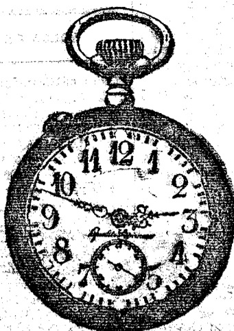
EL FANTASTICO GRAN NOVEDAD!

Gran facilidad de la Casa a los señores sacerdotes para adquirir este reloj.