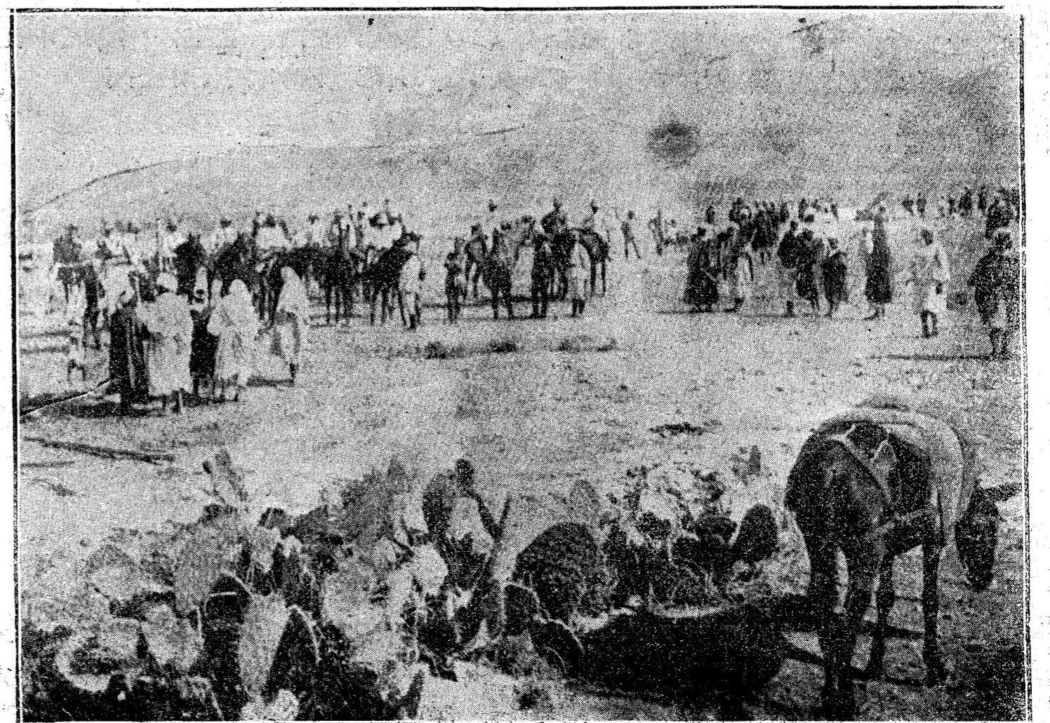
Nuevos zocos en Zeni-Sidel, inaugurado el lunes por el capitán general de Melilla. Se llamará del Tinain de Tetat.

Si lo expuesto es poco para demostrar las difíciles circunstancias en que labora el maestro público español, añadáse la desatención con que es tratado por parte de todos los Gobiernos; puesto que nuestros gobernantes reconocen cuán justas son las quejas que con tanta humildad eleva el mentor de