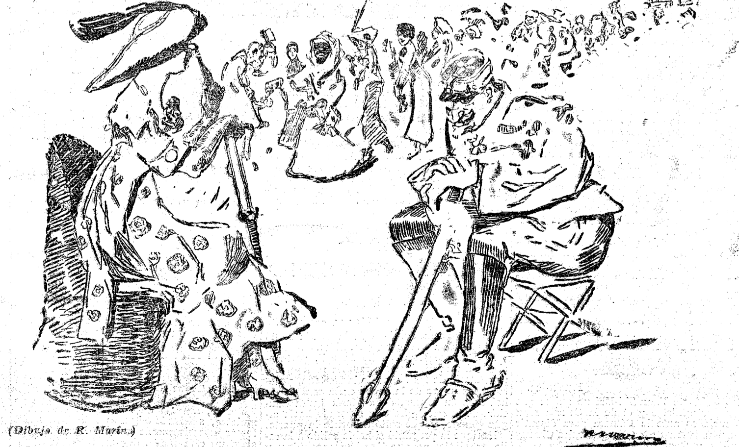
«Cuanta cola lleva el ex Sultán; qué prodigo se ha vuelto en Francia! Señora, más lo ha sido antes regentando un Imperio, y esta prodigalidad si que trae cola...»