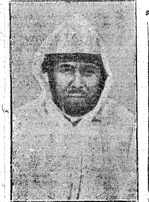
EL EX SULTÁN Abd-el-Aziz. ROMA