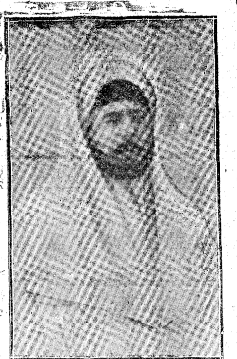
EL SULTÁN Muley Yusef. EL "KAGIOL"