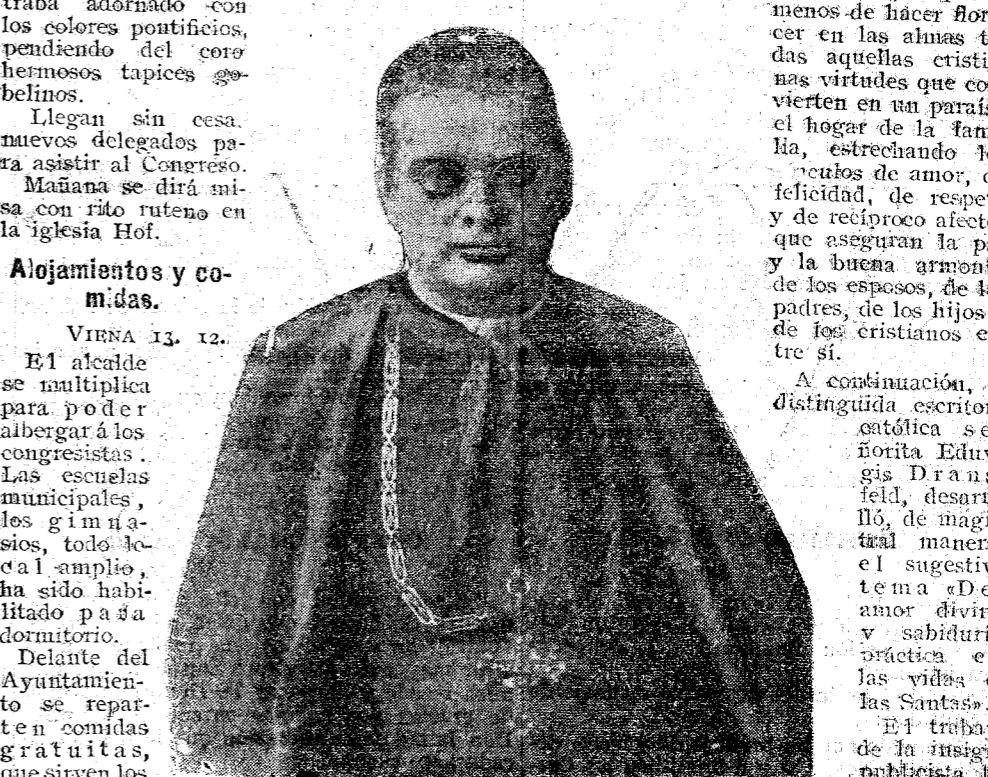
CARDENAL VAN ROSSUM. Legado Pontificio que asiste al Congreso Eucarístico representando a Su Santidad.