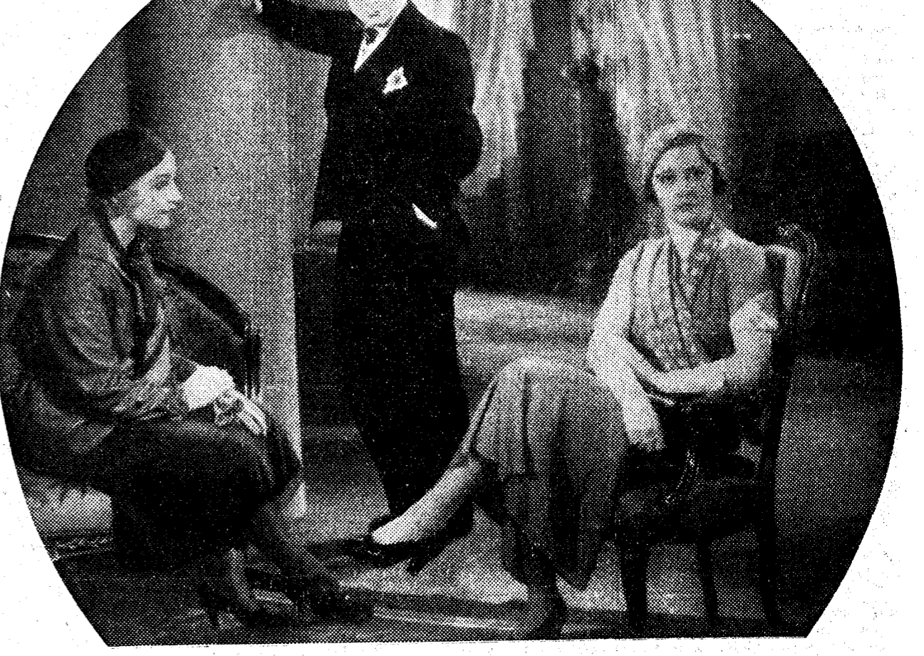
Arriba: Buster Keaton en "El amante improvisado", que se estrena hoy en el Palacio de la Música. Abajo: Marie Glory en un momento del "film" "Una hermanita deliciosa", que se estrena el lunes en Astoria

LAS ESTRELLAS Genialidades de Marlene Dietrich Un telegrama de Hollywood, fechado el 4 de enero, anuncia que la Paramount ha entablado un proceso contra Marlene Dietrich, en el cual la exige una indemnización de seiscientos mil dólares en concepto de daños y perjuicios por incumplimiento de contrato.