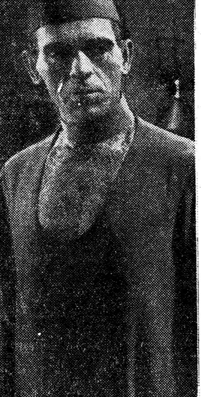
Karloff, el gran característico, en "La momia", "film" de enorme éxito que se proyecta en Avenida

lizado en esta nueva modalidad del "cinema", consigue en cada programa, dar al público emociones nuevas, mostrando cuanto de artístico y de interés existe y ocurre en el mundo.