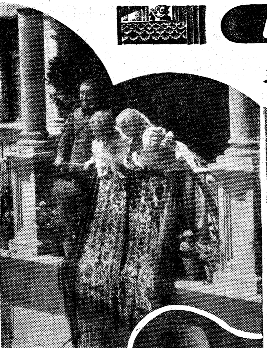
Una escena de "Violetas imperiales", cuya protagonista es Raquel Meller, y que pronto estrenará un aristocrático cinema

UN GRAVE INCIDENTE Ana era una mujer bellísima que, como su madre, para vencer la crueldad de la vida, llevando a su boca un pedazo de pan, vendía flores naturales en los humildes "coabarets" de Montmartre.