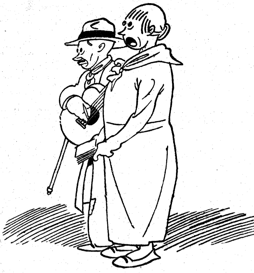
La rueda de Casanellas—te cantaré en un cantar, detenerlo y expulsarlo—y luego vuelta a empezar.