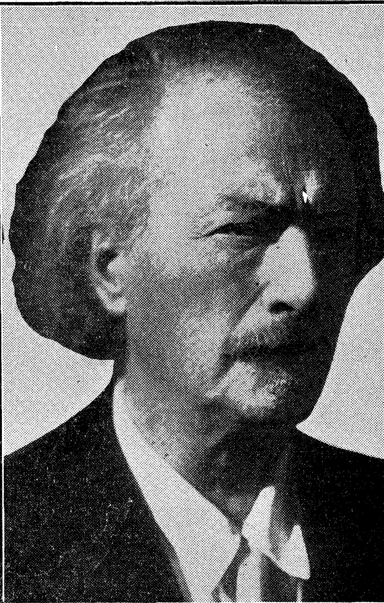
El eminente pianista Mr. Paderewski, a quien la ciudad de Varsovia ha concedido el Premio Nacional de Música