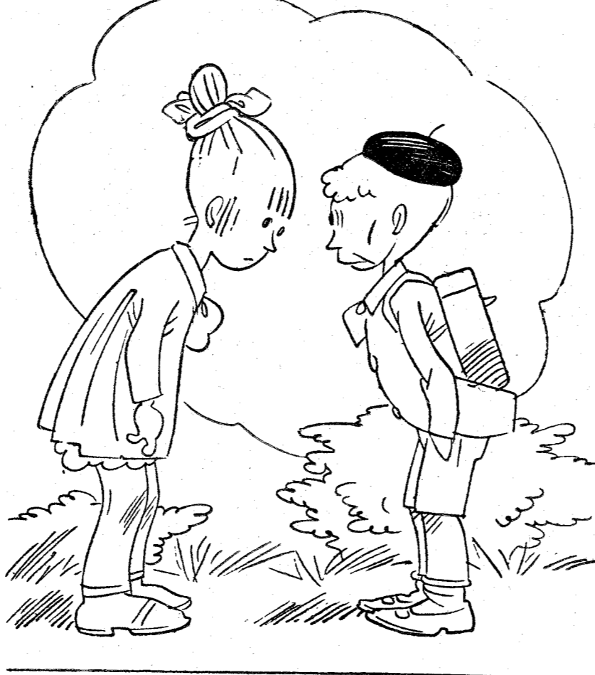
¿Quién te ha suspendido a ti? La misma que a ti. Doña Prudencia?