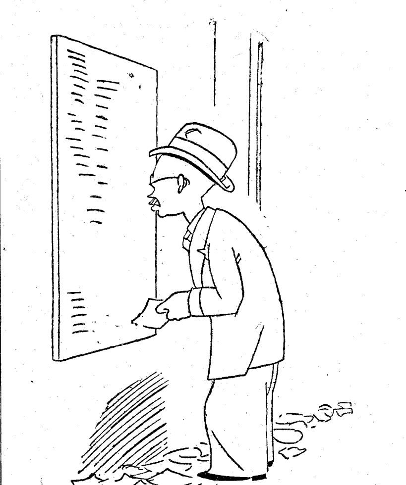
—¿Gobierno? ¡Ni siquiera una aproximación!