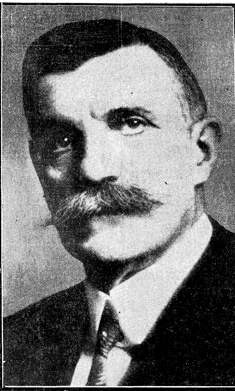
M. Poulet, uno de los jefes del partido católico belga, que acaba de celebrar su jubileo parlamentario

Durante veinticinco años M. Poulet ha representado en el Parlamento belga a los católicos de Lovaina. Quizás sea una de las personalidades más discutidas del partido. Detalle curioso: hijo de un profesor de Historia que daba su cátedra en francés, yerno de un profesor de Literatura francesa, de familia valona. Poulet es uno de los jefes del sector flamenco del partido católico. Figura también entre los demócratas cristianos. Ha sido presidente de la Cámara, ministro cuatro veces y jefe de Gobierno en coalición con los socialistas. Orador elocuentísimo, se hizo famoso en el debate de ley escolar defendiendo su propio proyecto.