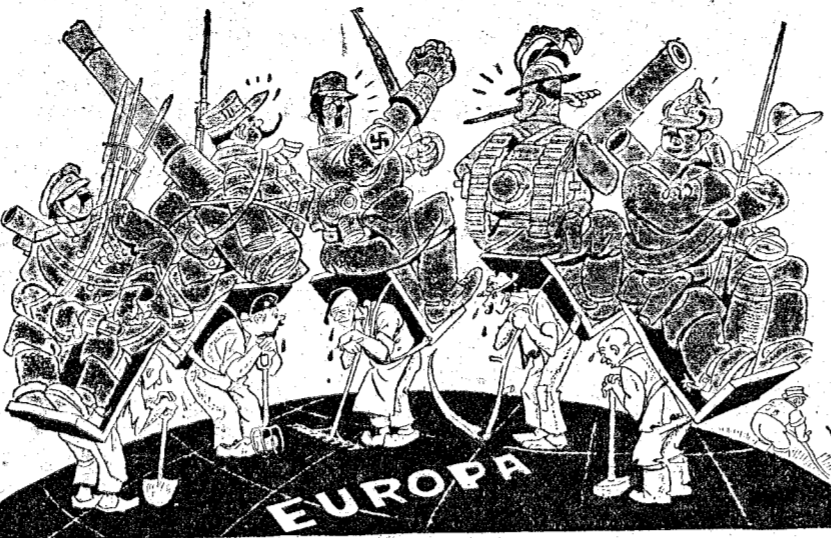
LOS POBRES EUROPEOS.—Luego dicen que lo hacen por defendernos. ("The Evening Standard", Londres.)