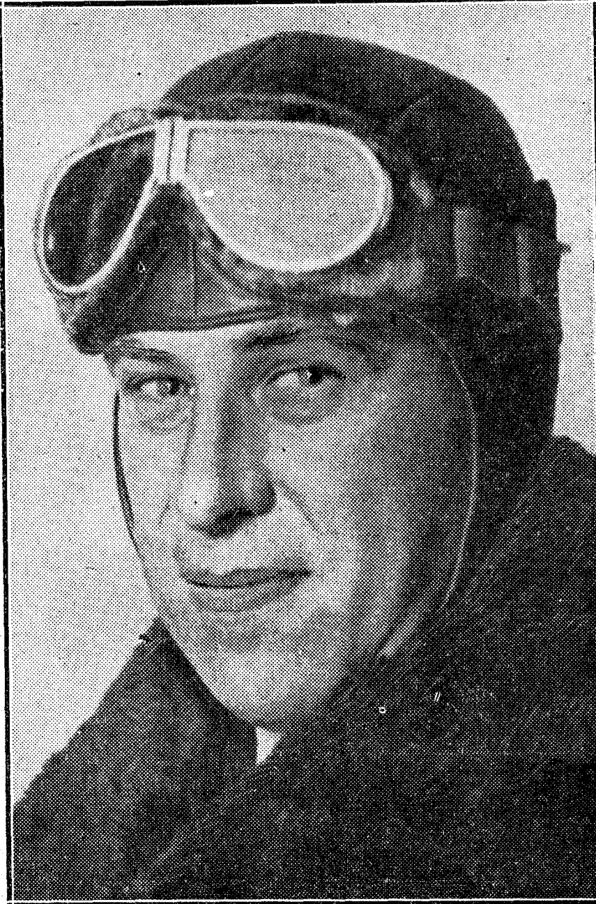
El comandante norteamericano Frank Hawks, que ha batido el "record" de velocidad a larga distancia