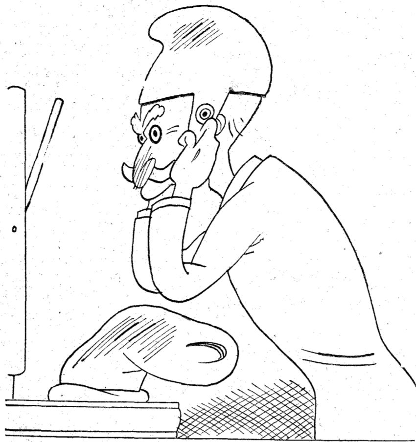
"En lo que me entretengo—cuando estoy solo: dejo la barretina—me pongo el gorro".