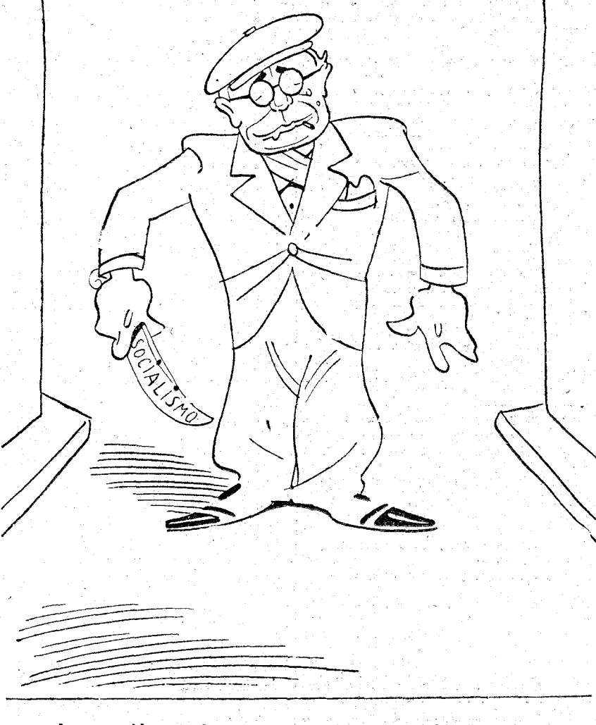
¡A ver quién es el guapo que pasa por aquí!