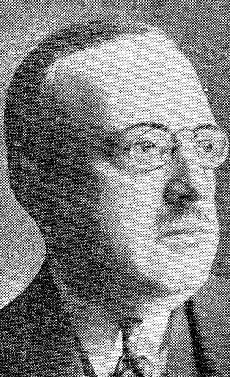
M. André Tardieu, ex presidente del Consejo francés, que se encuentra en España en viaje de turismo

Tardieu no ha querido entrevistarse con ningún periodista; ya recibido, durante su estancia en Barcelona, más de veinticinco peticiones de intervenció y a todas se ha negado. Viene con su máquina fotográfica; Tardieu es un excelente fotógrafo. En cierta ocasión pudo mostrar hasta 750 pruebas obtenidas en sus viajes. En política representa lo que los franceses llaman la "nueva generación", y ha sido muy combatido. Por lo demás, Tardieu ha sido diplomático y periodista; en 1914 peleó en las trincheras. En Versalles fué uno de los negociadores de la paz. Cuenta, ahora, cincuenta y siete años.