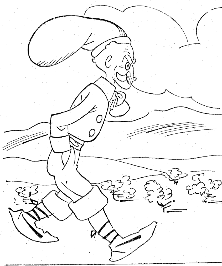
—¡Vaya, vaya! ¡Nunca falta un «viñuales» en la viña del Señor!