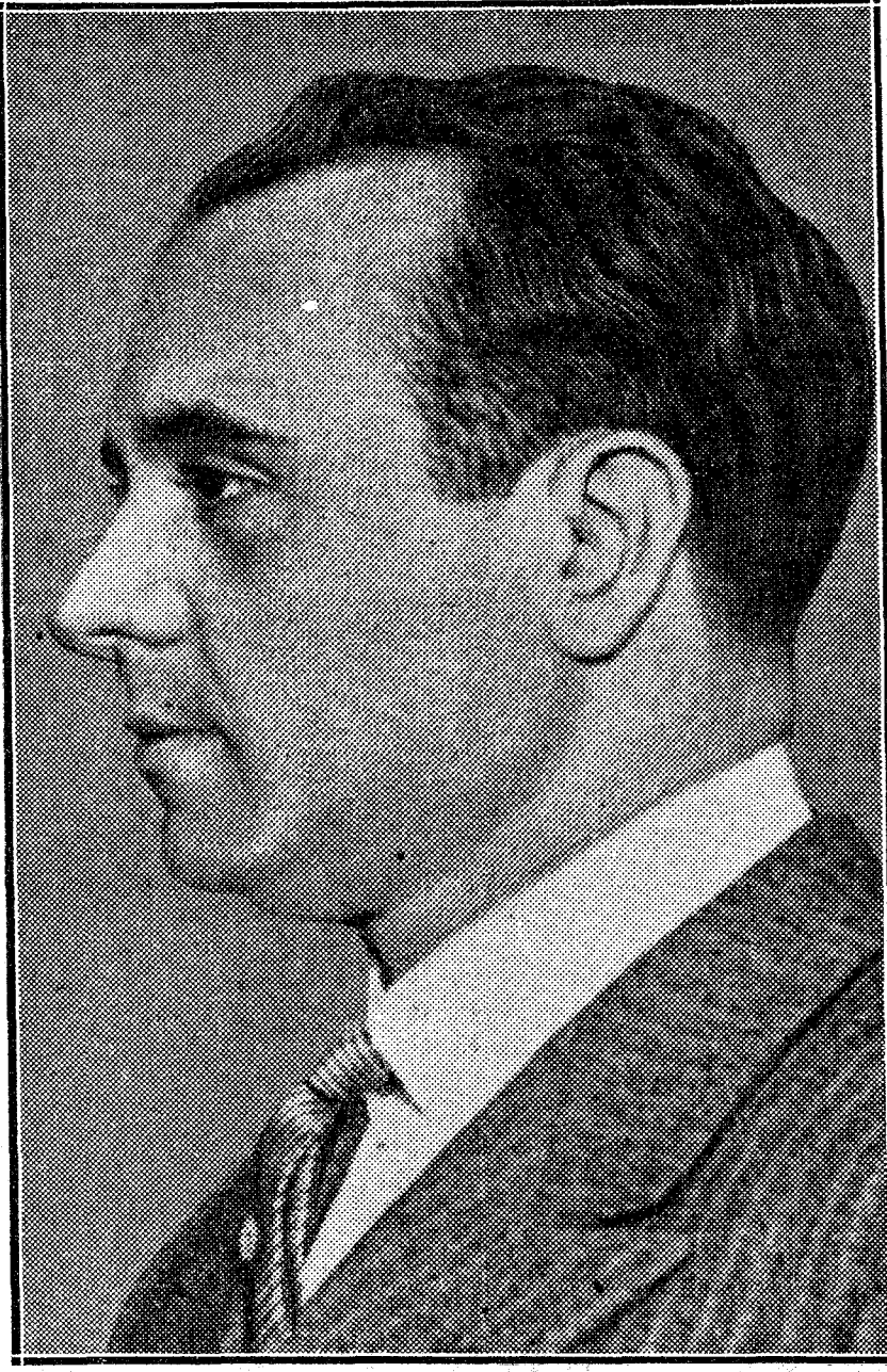
José Iturbi, pianista español, que ha dirigido la Orquesta Sinfónica de Nueva York, en el estadio de Lewinson, ante 10.000 espectadores, con un éxito extraordinario

Como pianista, la figura de Iturbi es de sobra conocida para que se haga precisa la presentación. Discipulo de Malats, en España, y de Wanda Landowska, en Francia, el pianista valenciano ha escuchado siempre entusiastas ovaciones en cuantos conciertos de piano ha interpretado.