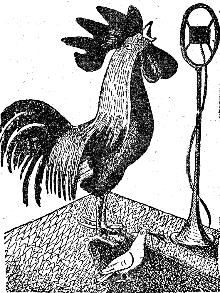
LA PALOMA DE LA PAZ.—Mientras éste habla yo no puedo decir nada. (Del "Jugend", de Munich.)