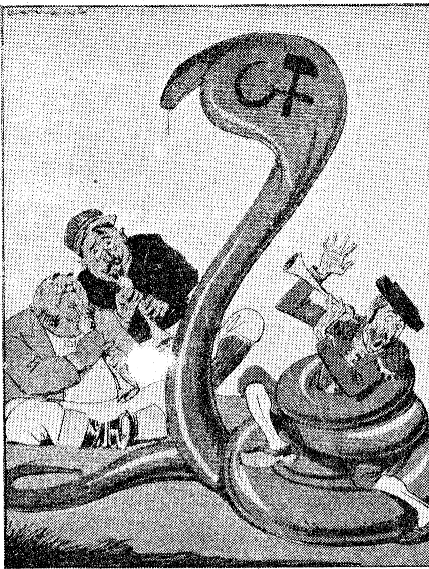
UNO QUE SE DESCUIDA... (Del "Kladderatsch", Berlín.)