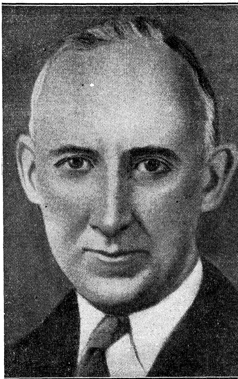
Raymond Moley, subsecretario del Departamento de Estado norteamericano, que ha dimitido su cargo

Moley es amigo íntimo de Roosevelt y ha dirigido durante meses el célebre "Trust de los cerebros", encargado de poner en práctica el programa del Presidente. Las causas de su dimisión han sido la hostilidad creada en los medios oficiales por su actuación en el "Trust de los cerebros" y la disparidad de criterio con respecto a su superior jerárquico el secretario de Estado Corder Hull, manifestada ya el día que Roosevelt desaprobó las declaraciones de Moley en la Conferencia de Londres.