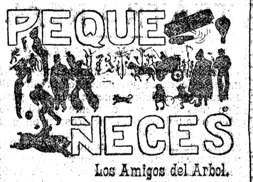
Los Amigos del Arbol.

Inauguración del Club Cocherito. La oratoria de los toreros. Bihao 7.—Se ha inaugurado el local del Club Cocherito con un banquete de 230 comensales, presidiendo Chiquito de Begoña. Se leyeron adhesiones de Bomba y Machaco, los cuales no pudieron asistir, y una conferencia de un revisor. A continuación brindó Chiquito de Begoña, siendo ovacionado. Se enviaron telegramas relatando el acto á Cocherito y Mazzantini. Este mandó un autógrafo reiterando su cariño á los vascongados.—Fabra.