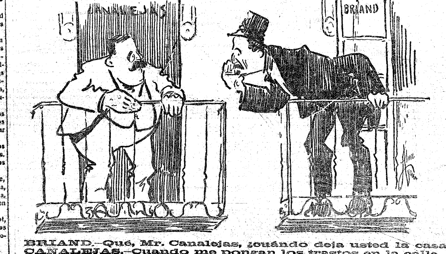
BRIAND.—Qué, Mr. Canalejas, cuándo deja usted la casa? CANALEJAS.—Cuando me pongan los trastos en la calle.