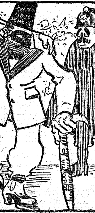
El disfraz es nostalgia.