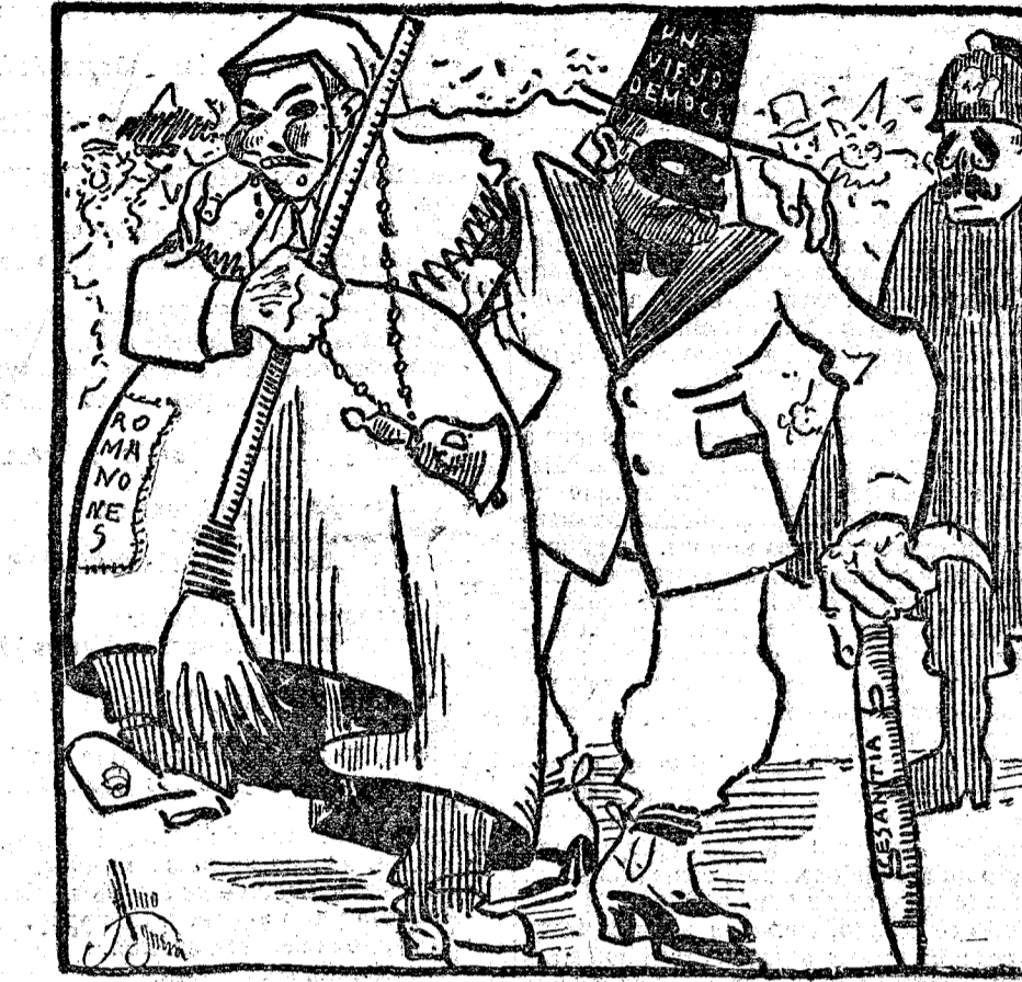
BURELL.—Apretemos el paso, que el guardia nos ha "calao".