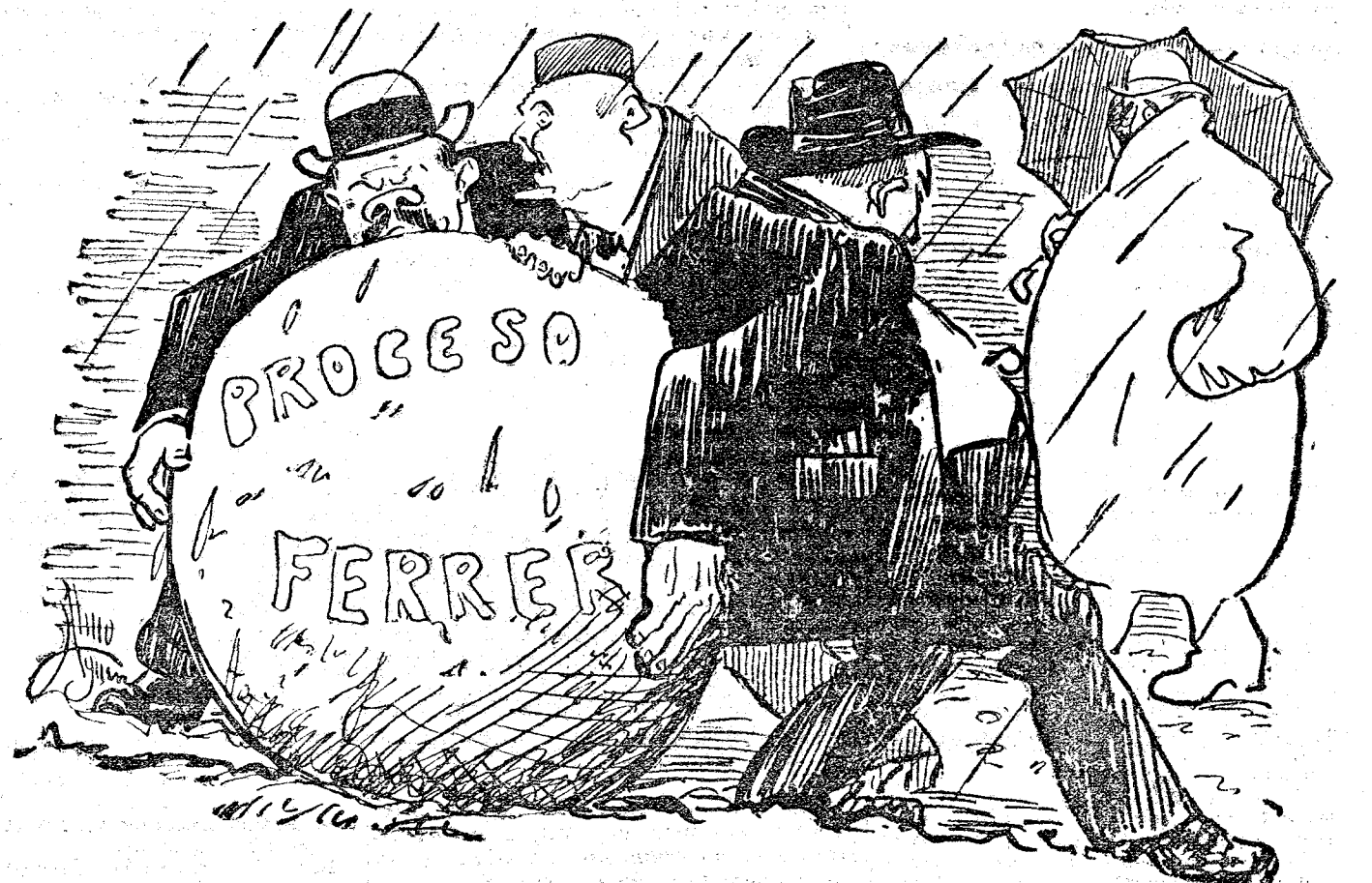
SORIANO.—Esto ha tomado demasiadas proporciones. De aquí no pasamos. CANALEJAS.—Sí, sí; y veréis cuando salga el sol, cómo todo se queda en agua.