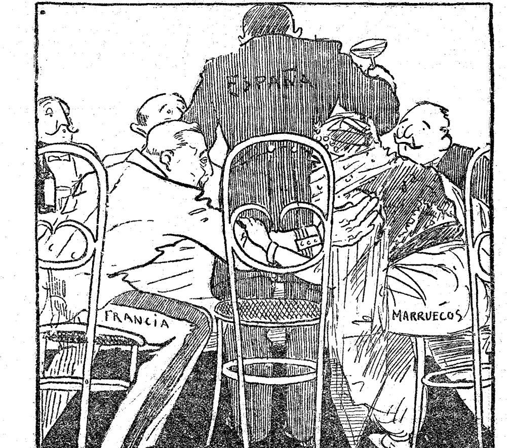
España (irriendando).—«Yo os aseguro que Francia, nuestra entrañable amiga, no dará ningún paso á espaldas de nuestro Gobierno.»