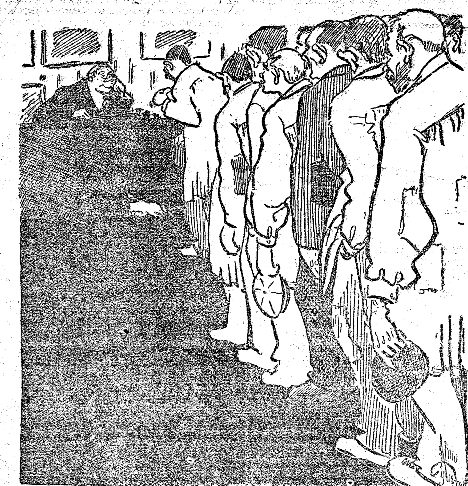
UN OBRERO.—Pues, verá usted, venimos "yo" y éstos "pa" que nos cuban el jornal. EL PATRONO.—¿No es es lo mismo que os suba la carne?