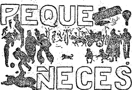
El oro extranjero.

El Gobierno presentó un proyecto de ley pidiendo la condonación de los derechos con que debía contribuir García Prieto por su título de marqués de Alhucemas. A eso se llama empaquetar al Tesoro público entre dos vergüenzas: la vanidad y la francachela.