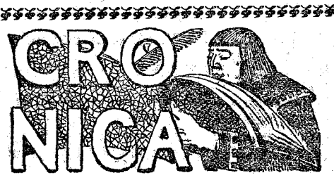
En la hora de las vindicaciones.

REVOLUCION EN MEJICO CONSEJOS DE MINISTROS Taft, intolerante. Washington 15.—El presidente Taft, ha participado al Gobierno mejicano que no tolerará más se verifiquen combates cerca de la frontera norteamericana. Informes consulares desmienten que tropas de la Unión hayan traspasado la frontera y entrado en territorio mejicano. Madero, desiste. Eagle Paso (Tejas) 15.—En vista del fracaso de las gestiones iniciadas por el señor Limantour para conciliar á los partidos opuestos, el general Madero ha declarado que desista de sus negociaciones en pro de la paz.