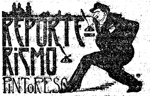
REPORTAJE RISMO PINTORES