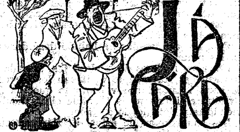
La Exposición Universal.

El entusiasmo por el Congreso Eucarístico en la provincia de Ciudad Real es extraordinario. Se han formado Juntas parroquiales de propaganda en los pueblos siguientes: Alcazar de San Juan, Alcubillas, Aldea del Rey, Argamasilla de Calatrava, Almadrón, Almagro, Almodóvar del Campo, Almodóvar, Arroba, Almadenejos, Bolaños, Calzada de Calatrava, Carrizosa, Còzar, Dalnicel, Fernán Caballero, Herencia, Hinojosa, Malagón, Montiel, Moral de Calatrava, Pedro Martín, Picintra, Puebla, Pozuelo de Calatrava, Torrenueva, Valenzuela, Villahermosa, Villanueva de los Infantes, Villarrubia de los Ojos, Viso del Marqués, Argamasilla de Alba, Cabezaradas, Cabezarribas, Campo de Criptana, Carrión de Calatrava, Fuentealmilla, Fuente el Fresno, Granatula, Guadalquivir, La Cañada, La Solana, Manzanares, Membrilla, Migelturra, Minas de San Quintín, Navalpino, Picón, Porcuna, Pozuelo de Calatrava, Puebla del Príncipe, Puerto Lápiche, Socuéllamos, Solana del Pino, Torre de Juan Abad, Valdepeñas, Villamanrique y Villanueva de la Fuente.